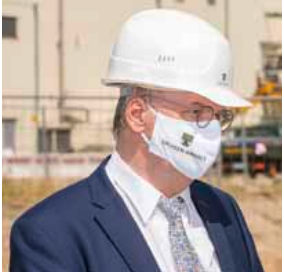
Dr. Rainer Haseloff (CDU) – Ministerpräsident von Sachsen-Anhalt

Wo sehen Sie Ansätze, diesen positiven Trend (Impulse aus starkem Mittelstand für die Regionalentwicklung) in den kommenden Jahren zu verstärken?